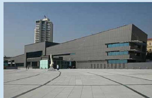
Centro de Convenções em Istambul receberá mais de oito mil participantes para a 28ª edição do ESHRE

Uma das apresentações orais do Fertility, intitulada “Perfis químicos de meios de cultura de embriões por espectrometria de massas para ensaio de controle de qualidade”, está concorrendo ao prêmio de melhor trabalho na categoria ART Laboratory Award .